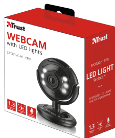
PACKAGE VISUAL 1