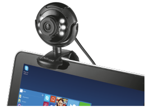
PRODUCT EXTRA 1