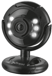
PRODUCT VISUAL 1