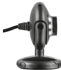
PRODUCT SIDE 1