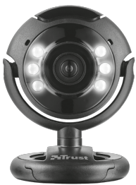
PRODUCT FRONT 1