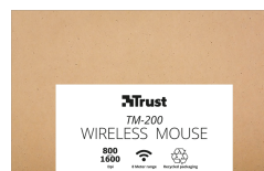
PACKAGE FRONT 1