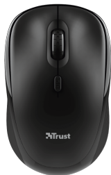
PRODUCT TOP 1