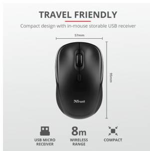
PRODUCT PICTORIAL 3