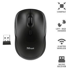
PRODUCT ESHOT 1