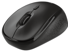
PRODUCT VISUAL 1