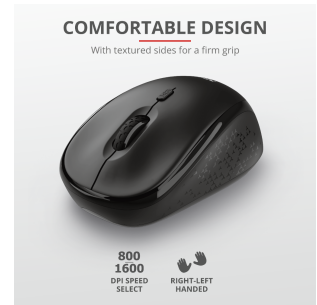
PRODUCT PICTORIAL 2