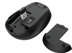
PRODUCT BOTTOM 1