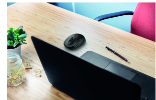
LIFESTYLE VISUAL 1