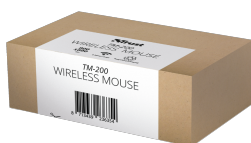
PACKAGE VISUAL 1